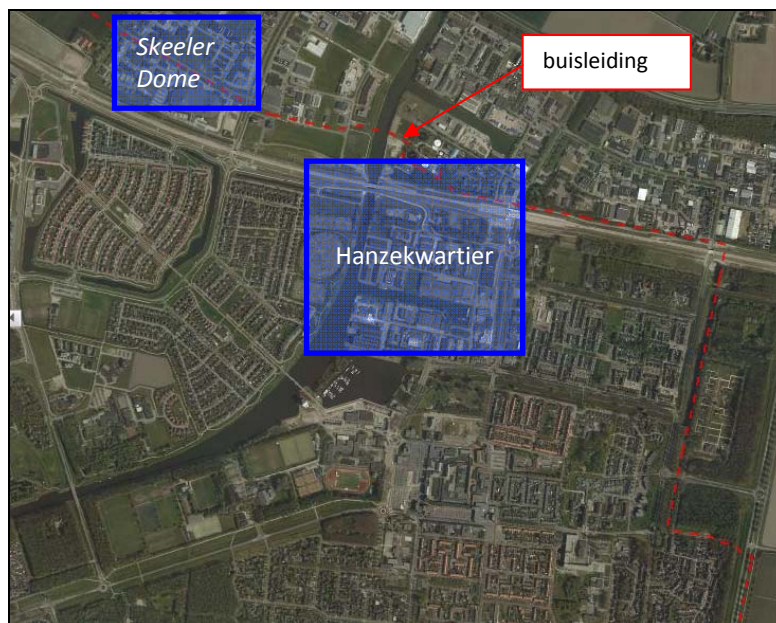
Figuur 1.2 Globale ligging van Skeeler Dome ten opzichte van Hanzekwartier

Naast de ontwikkeling van het 'Hanzekwartier' is ook de ontwikkeling van Leisure World Skeeler Dome van belang vanwege de hogedruk-aardgastransportleiding (zie figuur 1.2).