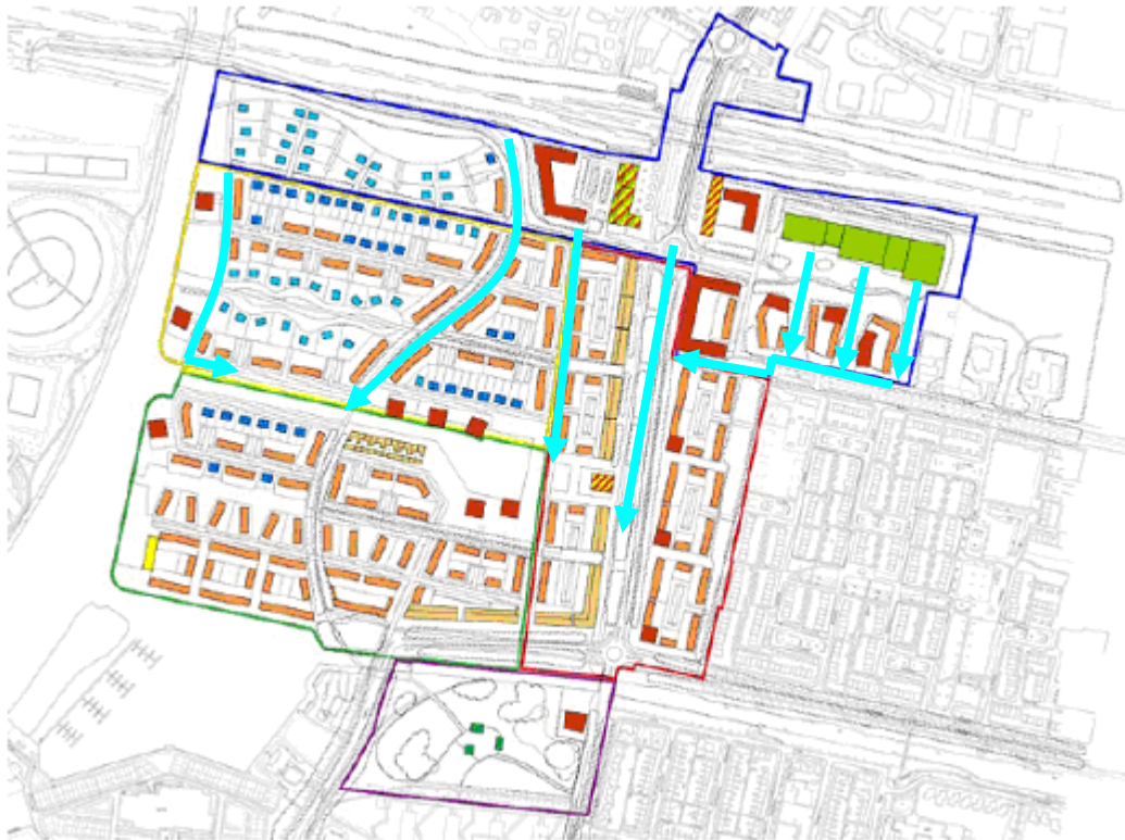
Figuur 3.1 Vluchtroutes voor het spoor en snelweg (lichtblauwe pijlen), ondergrond: 'Voorontwerp' gemeente Dronten

In figuur 3.1 zijn de vluchtmogelijkheden weergegeven bij een BLEVE op het spoor. Met blauwe pijlen zijn de wegen aangegeven die gebruikt kunnen worden. Indien er geen barrières (bijvoorbeeld waterpartijen zijn in de zuidelijk gelegen wijken is het mogelijk om doelmatig het gebied te ontvluchten. Aan de westzijde van het gebied is er een aandachtspunt bij de havenarm 'Lage Vaart' die de woonwijken op ongeveer 250 meter van het spoor afsluit van het zuidelijk gelegen gebied.