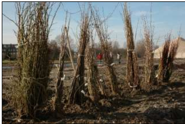
Figuur 1 Bosplantsoen

Landschapsbeheer adviseert hoofdzakelijk het aanplanten van bosplantsoen. Dit is klein plantmateriaal van 60 - 100 cm lengte en heeft een "kale" wortel (zie figuur 1). Na levering moet bosplantsoen direct ingeplant worden. Lukt dit niet, dan moet het ingekuild worden (voor werkwijze zie folder "Erfbeplanting in Flevoland" pag. 15).