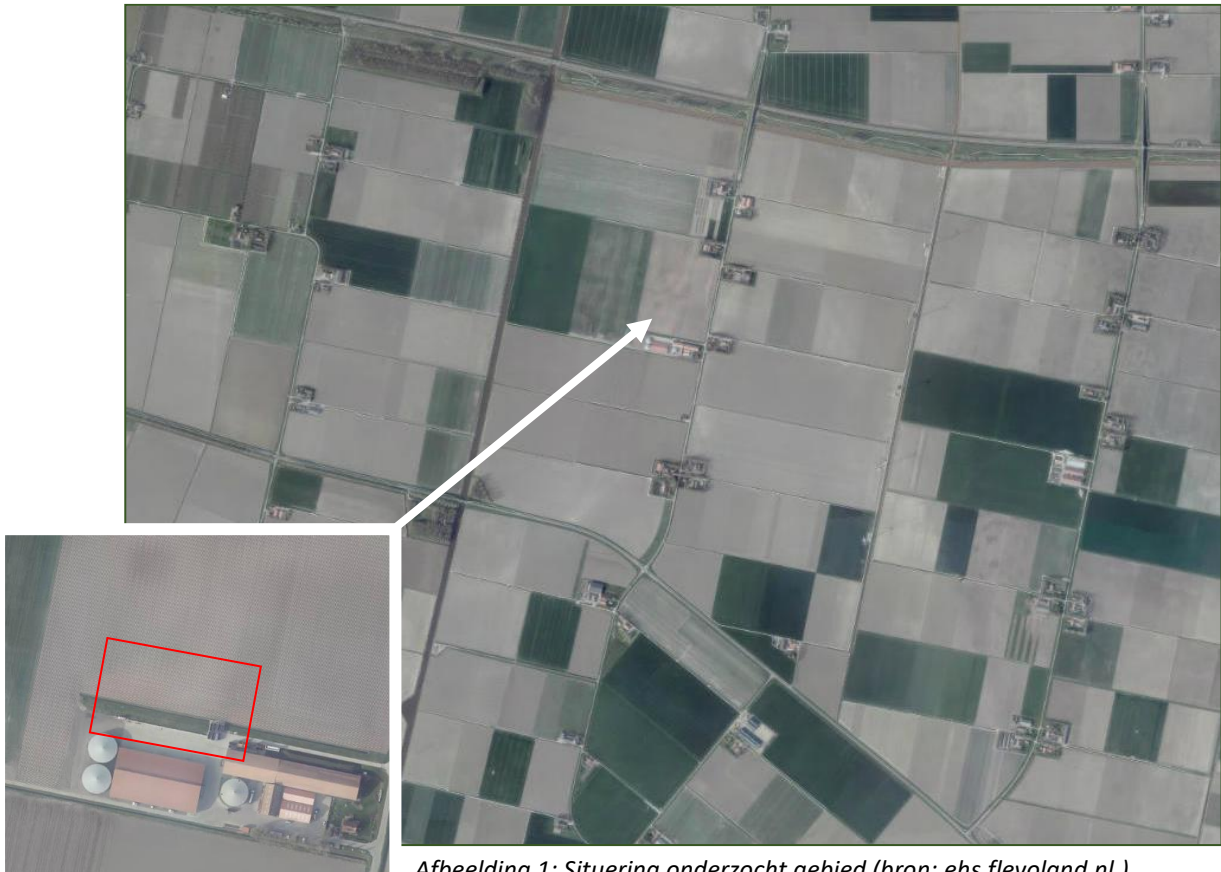
Afbeelding 1: Situering onderzocht gebied

Het plangebied ligt ten oosten van de bebouwde kern van Dronten en betreft een onbebouwd weiland. De percelen zijn afgerasterd met schrikdraad.